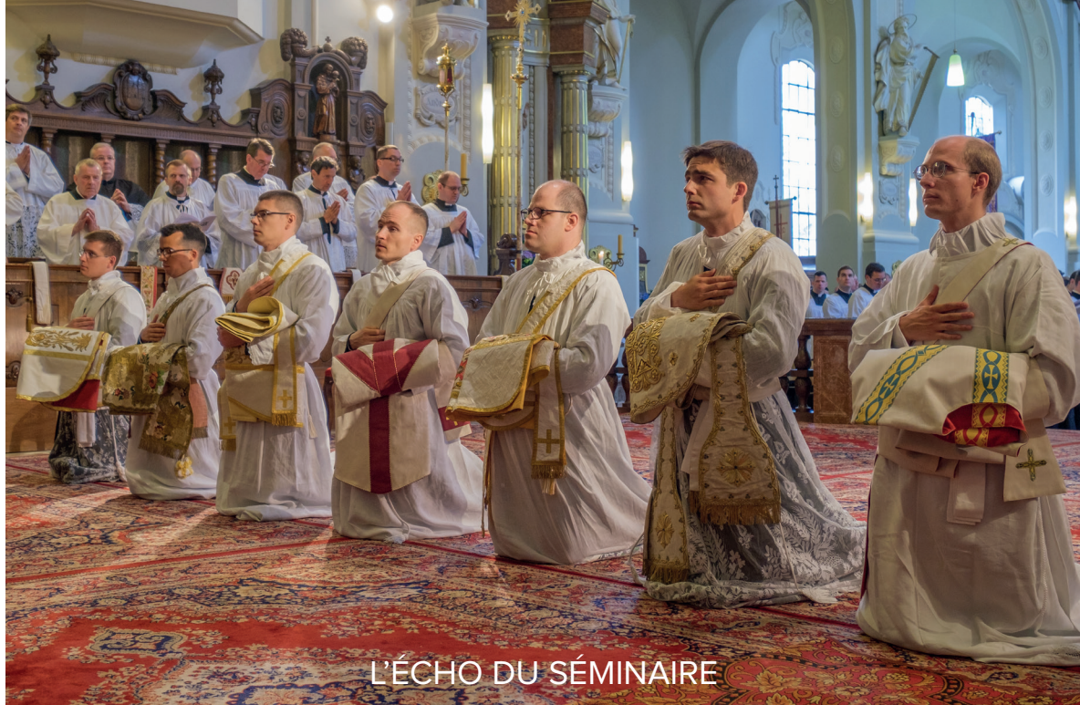
L'ÉCHO DU SÉMINAIRE